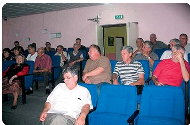
Sastanak u MZ Odžaku II

Na sastancima su predloženi ciljevi projekta kao i svrha organizovanja sastanaka sa zahtjevima da se delegiraju prioritetni problemi sa kojima se stanovnici susreću. Na osnovu toga bit će sačinjene liste prioriteta koji će biti polazni osnov LAG-ovima da pristupe izradi akcionih planova. Sačinjeni akcioni planovi putem kampanja zagovaranja predloženi su lokalnoj vlasti.