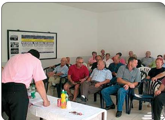
Sastanci u MZ Makljenovac