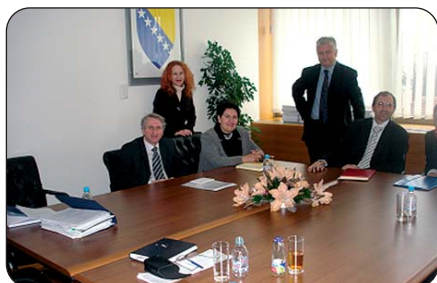
Lobiranje kod većih institucija vlasti / Ministarstvo za izbjeglice i raseljena lica/osoba BiH, Safet Halilović - ministar sa saradnicima