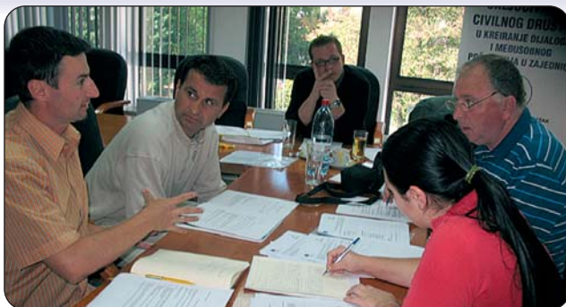
Trening operativno planiranje

Drugi trening je - Javno zagovaranje i PR obuka - sticanje znanja i vještine članova LAG-a za traženje vladine odgovornosti (odgovornosti za lokalne vlasti, kanale donošenja odluka, kako komunicirati sa njima, kako mobilizirati zajednicu da utiče na ljude koji donose odluke, kako koristiti medije itd.).