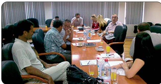
Trening javno zagovaranje