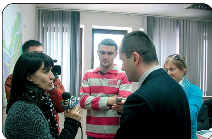
Medijska promocija projekta