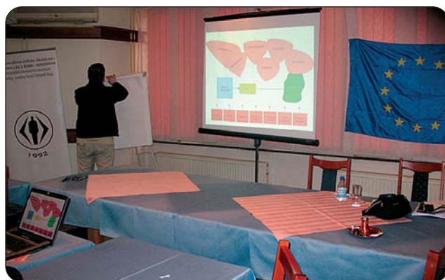
Trening operativno planiranje

Svrha ovog treninga je omogućavanje članovima LAG-a da kreiraju planove projekta u dugoročnom i kratkoročnom smislu, kao i posredne operativne ciljeve i mjere bazirane na identifikaciji potreba povratnika / izbjeglica- građana.