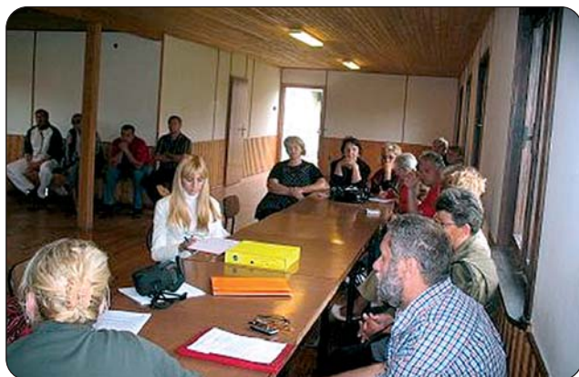
Sastanci u MZ Doboju