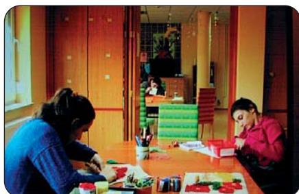
Pozitivni primjeri povratka