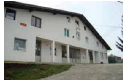
MZ Hambarine, Prijedor