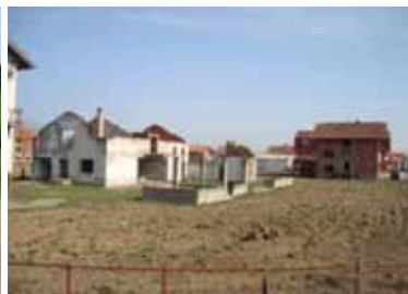
MZ Jakeš, općina Odžak