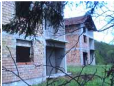
MZ Centar, općina Zavidovići