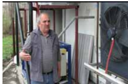
„Voćar“ Glumina, opština Zvornik