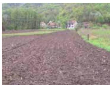
MZ Bočinja, općina Maglaj