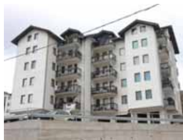
Naselje Garča, opština Višegrad