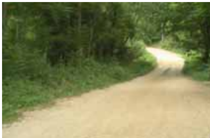
Put Glavatičevo – Krupac, općina Konjic