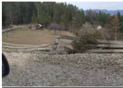
Selo Vijaka, općina Vareš