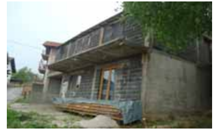
Gornja Mahala, općina Donji Vakuf