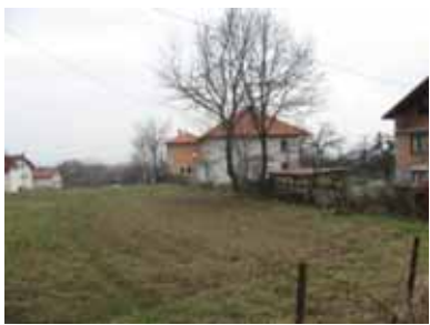
Gornji Kotorac, opština Istočna Ilidža