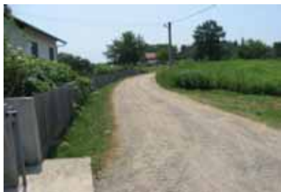
MZ Komarice, opština Doboj