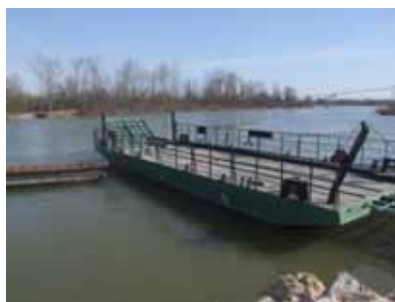
MZ Janja, opština Bijeljina