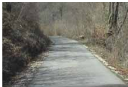
Put Šadići – Ćurevo, opština Foča