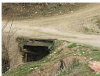
MZ Kozići, opština Rogatica