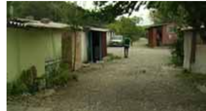
Kolektivni centar Tasovčići, Čapljina