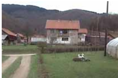
MZ Milijeno, opština Čajniče