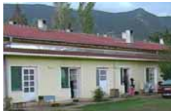
Žuta kuća Mostar