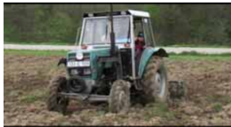
Selo Gojčin, općina Kalesija