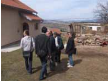
MZ Nišići, općina Ilijaš