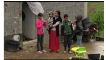
Modriča grad, Romsko naselje