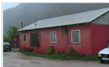
Kolektivni centar Gornja Kolonija, Jablanica