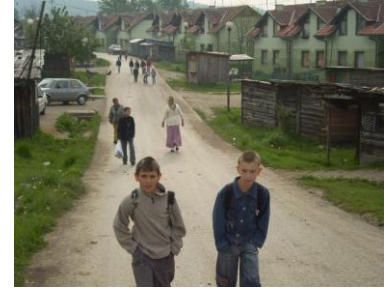
Kolektivni centar Mihatovići

Kada se radi o problematici rješavanja kolektivnih centara uprkos činjenici da se ovom problematikom bavi veliki broj institucija i organizacija (opštine, entiteti, ministarstva, strane implementing organizacije, UNHCR, OSCE), nas kao Savez udruženja udruga izbjeglica, raseljenih lica i povratnika u BiH je interesovalo koliko je registrovano kolektivnih centara i njihovih korisnika u BiH, da li ih neko finansira, da li su korisnici interno raseljena lica (sa prijeratnom privatnom imovinom), interno raseljena (bez prijeratne privatne imovine) ili lica bez statusa.