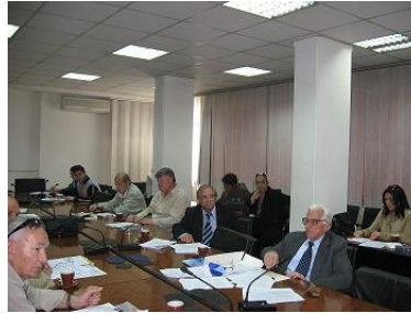
Prošireno Predsjedništvo, Tuzla