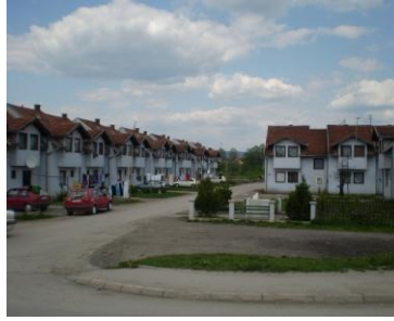
Kolektivni centar Karaula