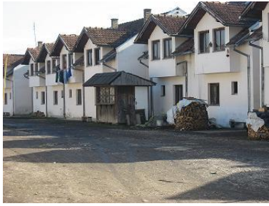
Kolektivni centar Višća